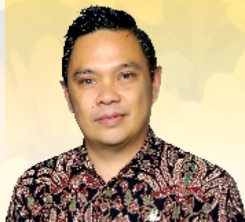
NOVI A. H. POLITON, SE, MM PENANGGUNGJAWAB