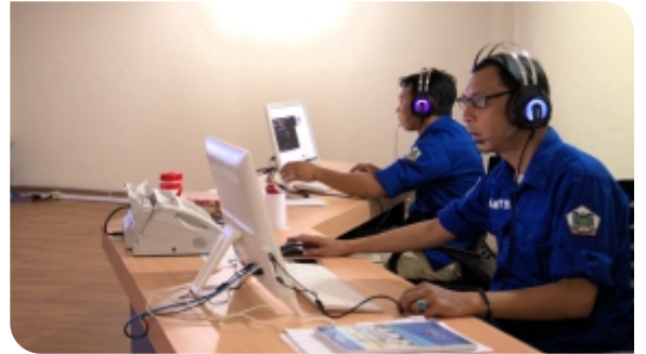
EMERGENCY CALL CENTER 112

M empunyai tugas pokok melaksanakan tugas penyiapan perumusan dan pelaksanaan kebijakan, penyusunan norma, standar, prosedur dan kriteria, dan pemberian bimbingan teknis dan supervisi, pelaksanaan koordinasi serta pemantauan, evaluasi dan pelaporan di bidang layanan Disaster Recovery Center dan TIK Pemerintah Daerah, Integrasi layanan publik dan pemerintahan, layanan keamanan informasi e_Government, layanan sistem komunikasi intra pemerintah daerah, penguatan kapasitas sumber daya komunikasi publik dan penyediaan akses informasi. Layanan nama domain dan sub domain bagi Lembaga, pelayanan publik dan kegiatan daerah, pengembangan sumber daya TIK pemerintah daerah dan masyarakat, penyelenggaraan Government Chief Informasi Officer (GCIO) pemerintah daerah dan dibidang tata kelola persandian, operasional pengamanan, pengawasan dan evaluasi penyelenggaraan persandian. Bidang Penyelenggaraan Informasi dan Persandian terbagi 3 seksi yaitu Seksi pengelolaan sumber daya komunikasi dan penyelenggaraan informasi, Seksi keamanan transaksi elektronik serta Seksi persandian.